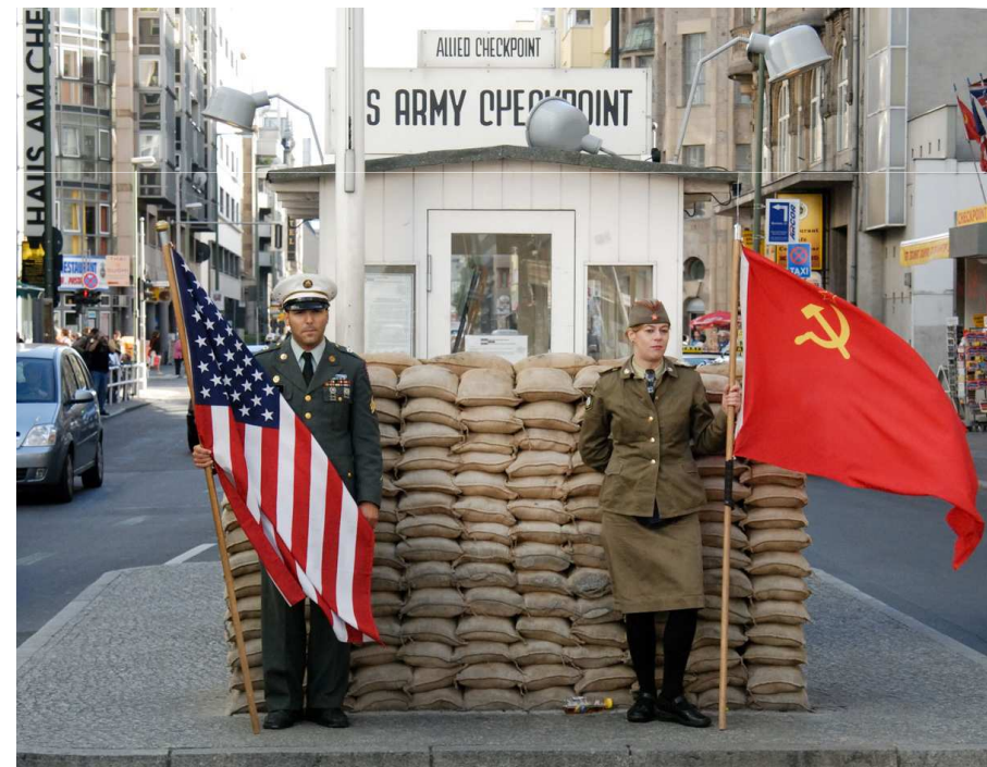
Check point Charlie