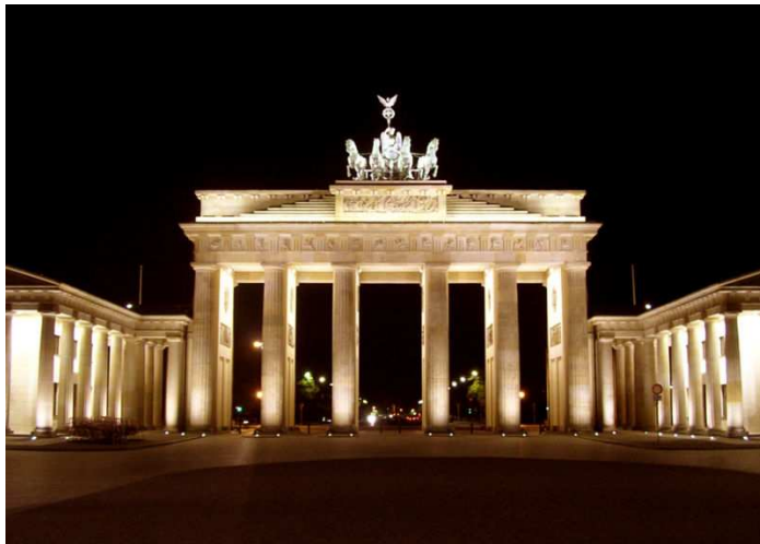
La porte de Brandebourg